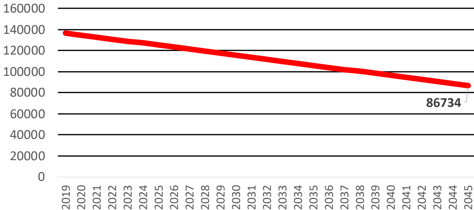
RV088: RAHVASTIKUPROGNOOS 2020-2045: (põhistsenaarium) Rahvaarv, 1. jaanuar (Statistikaamet)